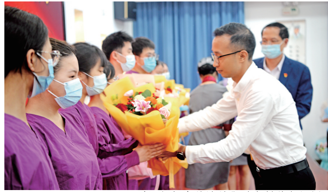
副区长杨泰给队员们送上鲜花与祝福。

2022年11月23日，蕉城区支援福州抗疫队返蕉欢迎仪式在我院举行。蕉城区人民政府副区长杨泰代表区委、区政府给队员们送上鲜花，欢迎他们凯旋而归，蕉城区卫健局党组书记、局长黄青松主持仪式。