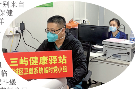
的旗帜，感受到党组织的温暖，坚定战胜疫情的信心决心。