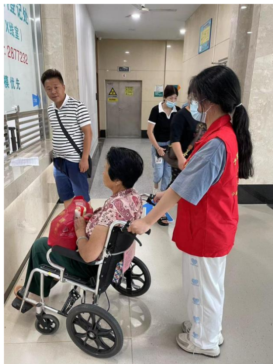
关爱老人助老专座

在门诊大厅自助机旁、各诊区，随时都可以找到身穿红马甲的志愿者，他们手把手指导老年患者使用自助机进行挂号、缴费、检查预约、取药、取用轮椅等操作，为老年患者就医提供便利服务。