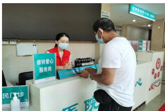
老年人智慧就医指导服务