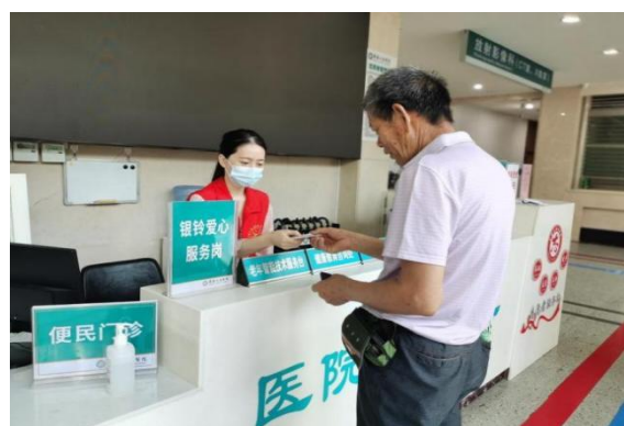
检查前预约助行服务